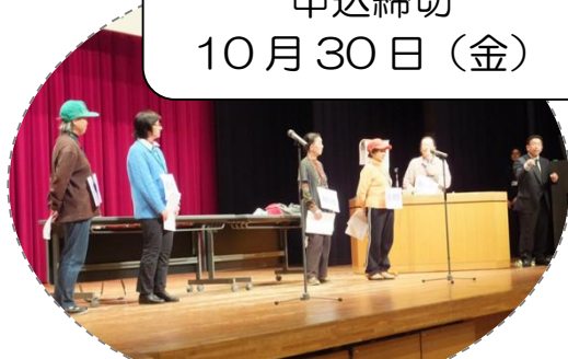
大和市での「防災寸劇」のようす

★会場は、かなテラス活動支援室（かながわ男女共同参画センター）講座・発表会共 JR藤沢駅 小田急線藤沢駅 江ノ島電鉄藤沢駅 下車 徒歩 10分（地図は、裏面参照）